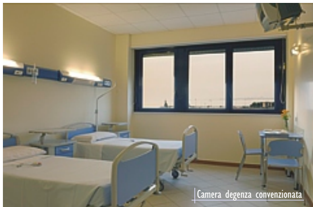
Camera degenza convenzionata

La Casa di Cura Bernardini è composta da un'ampia struttura con una superficie complessiva di circa 9000 mq., circondata da una vasta area in cui oltre a 200 posti auto vi sono varie zone ricche di verde.