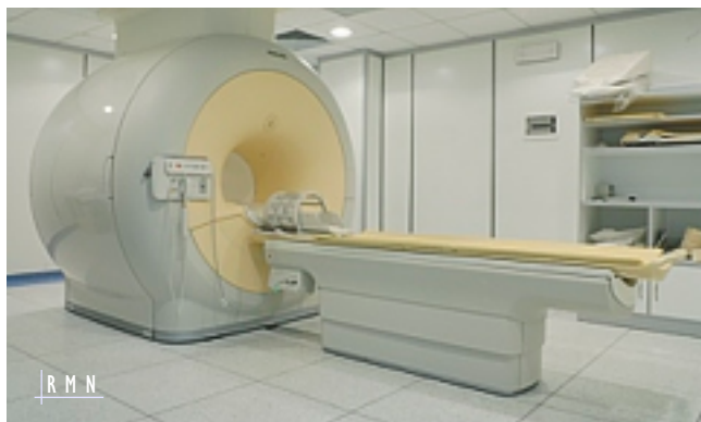
R M N